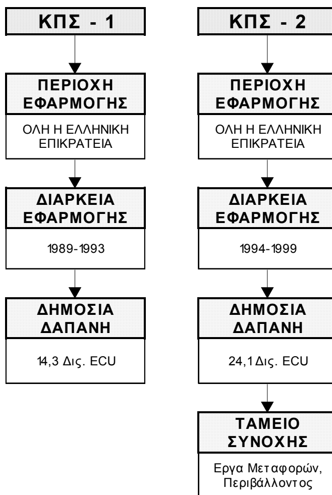
ΠΙΝΑΚΑΣ 1 : ΒΑΣΙΚΑ ΔΕΔΟΜΕΝΑ ΤΩΝ ΚΠΣ